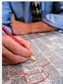
Búsqueda de Empleo