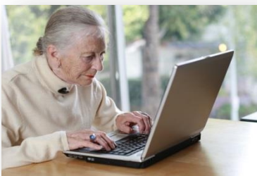
Habilidades de trabajo

Se les da prioridad a los veteranos, personas discapacitadas, bajo nivel educativo, más de 75 años de edad, pocas probabilidades de empleo, sin hogar or con riesgo de no tener hogar.